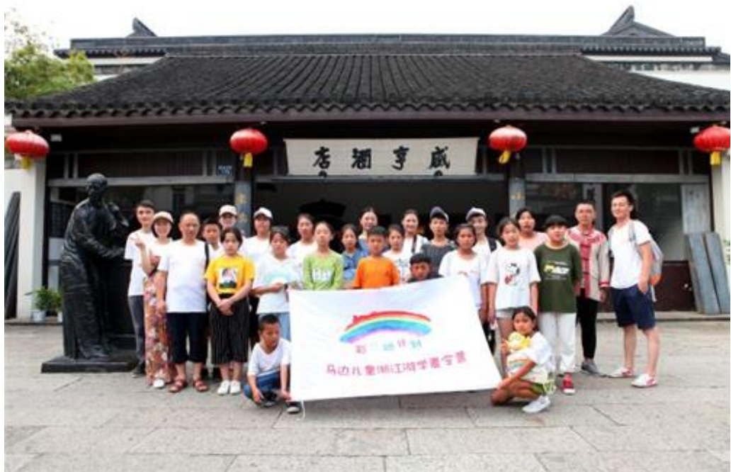
彩虹桥计划夏令营（马边儿童游学浙江的暑期活动）