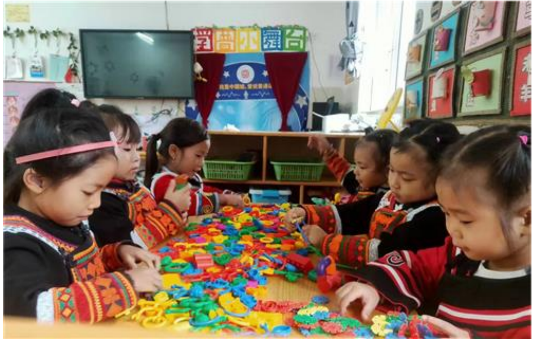
彝娃在儿童之家欢度节日（2022年6月1日）