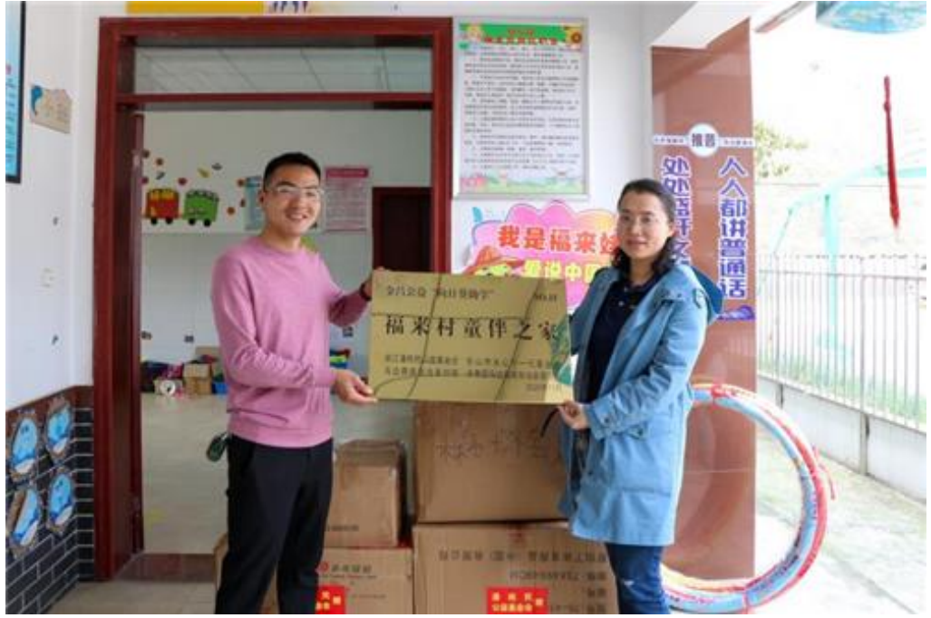
已为马边彝族自治县筹建完成了 26 所儿童之家（挂牌运营）