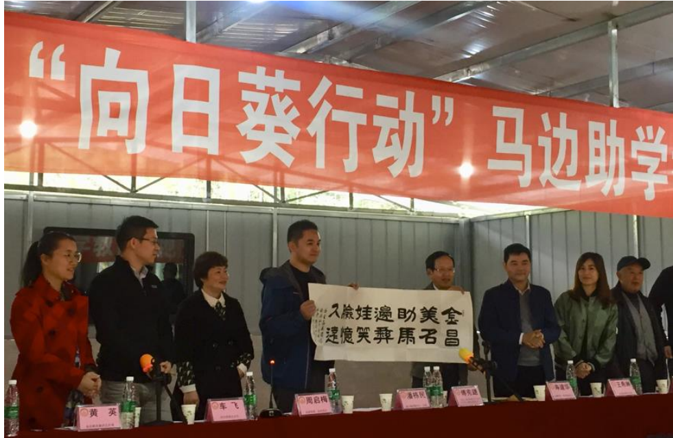
向日葵助学正式启动后，每年做好实地回访